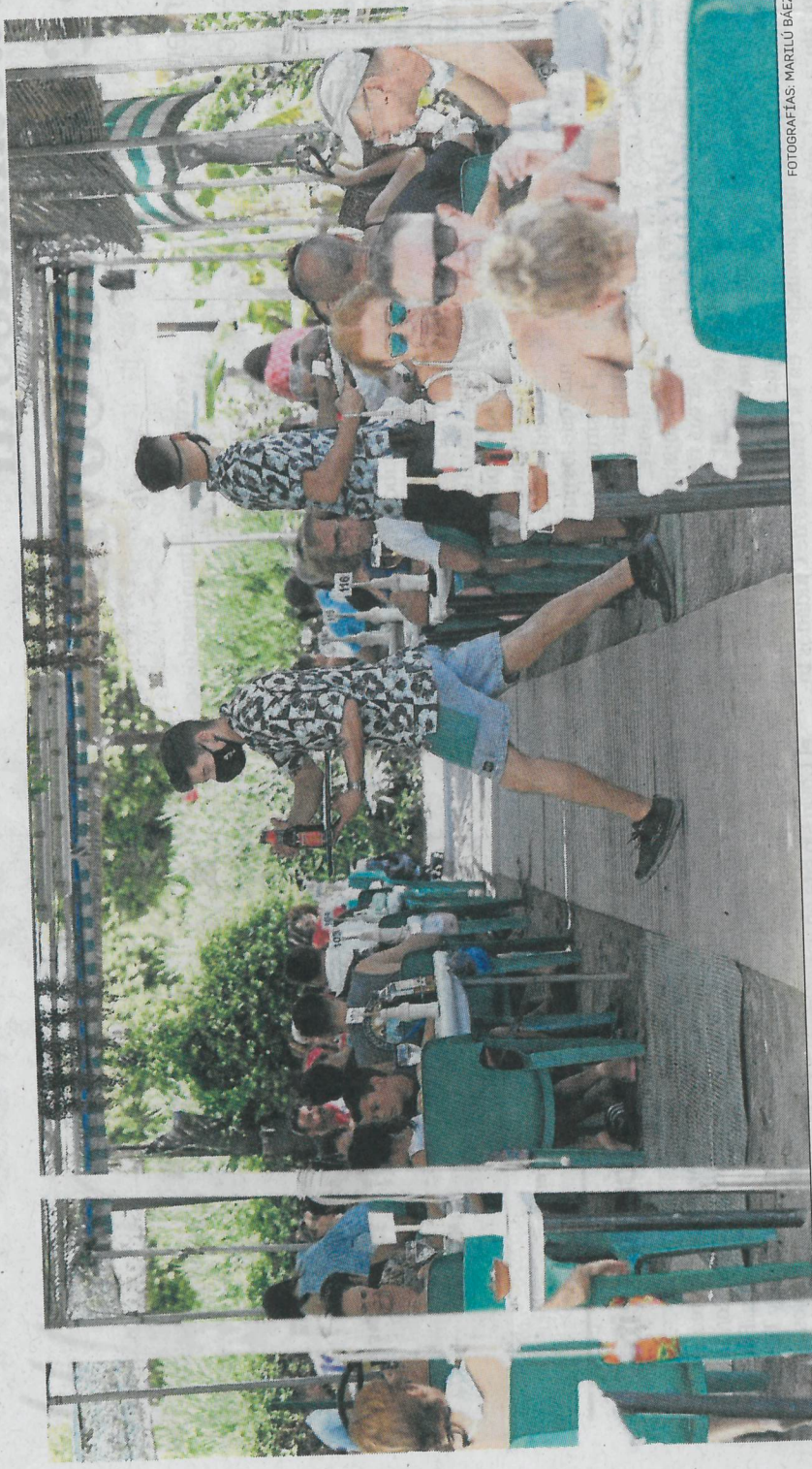
Dos camareros atienden una terraza llena de un chiringuito.

● Desde la Federación de Empresarios de Playas aseguran que el turismo nacional ha jugado un papel clave en la recuperación