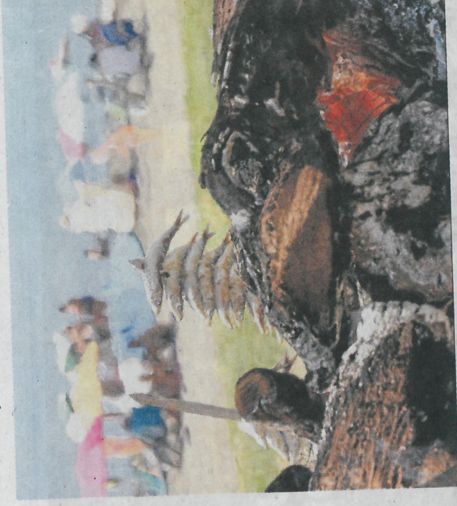
Un espeto de sardinas en uno de los chiringuitos del litoral axárquico.