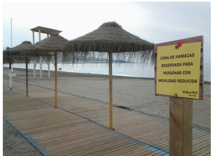
Zona de sombras