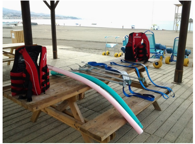
Material de préstamo para el baño