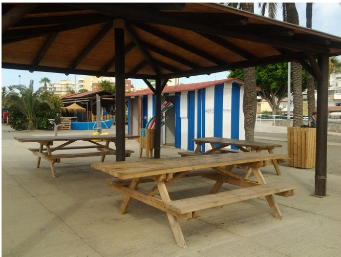
Zona de descanso