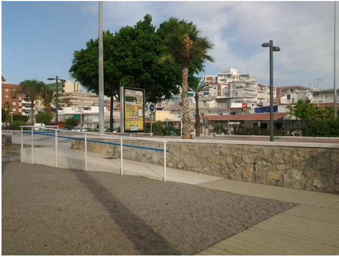
Rampa de acceso