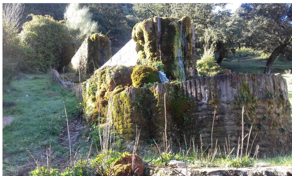
pilar en el camino.