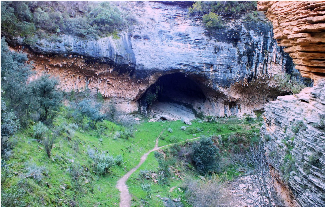
Cueva de los aviones en el Tajo del Abanico.