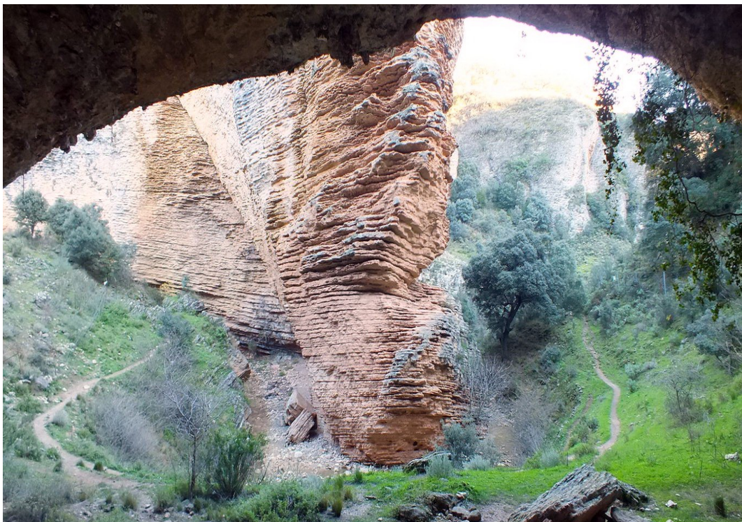
Tajo del Abanico.