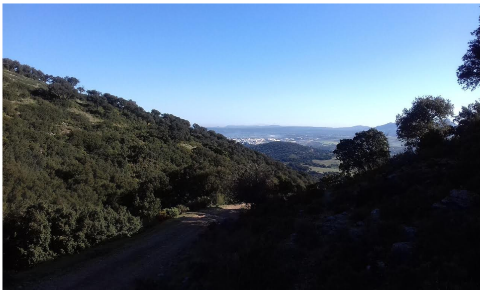
inicio de ruta, Ronda al fondo.