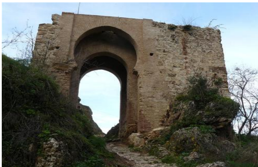
Puerta del Viento.