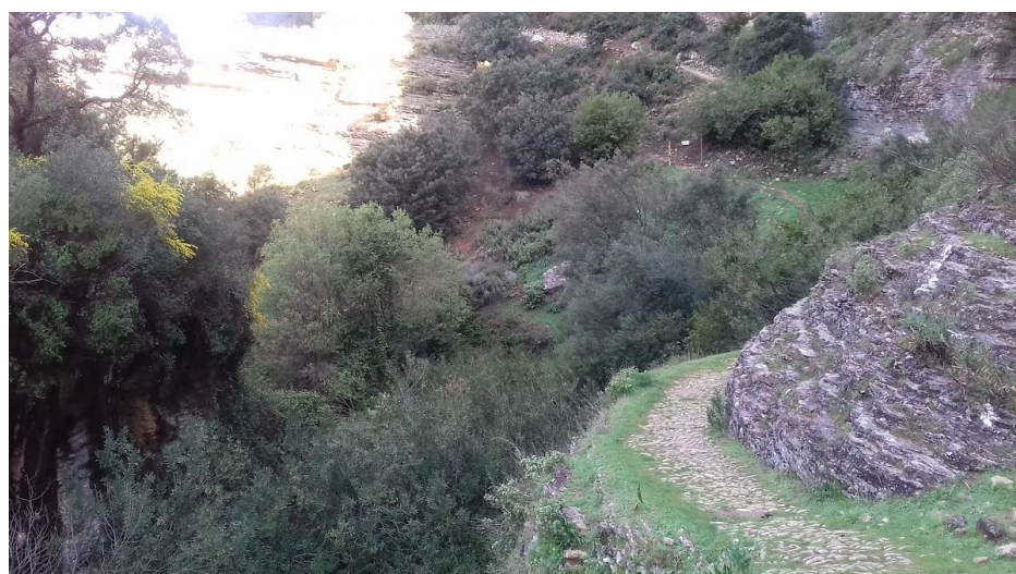
Camino empedrado en el Tajo del Abanico.