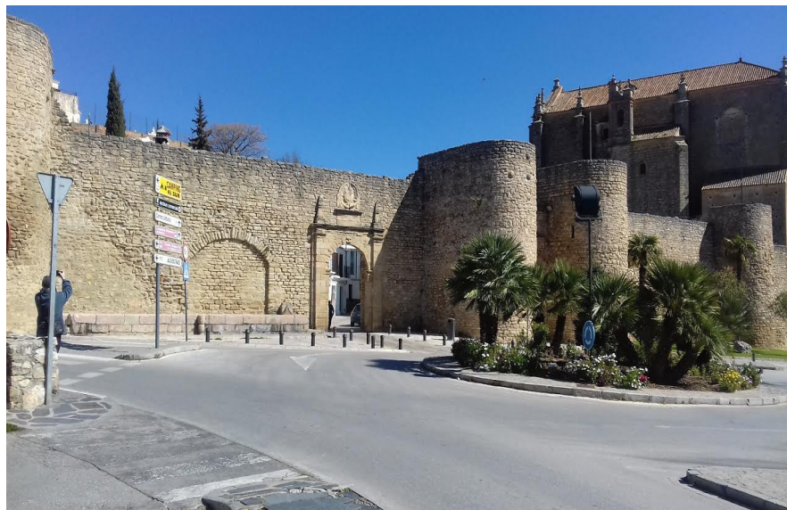
Muralla y puerta de Almocábar.