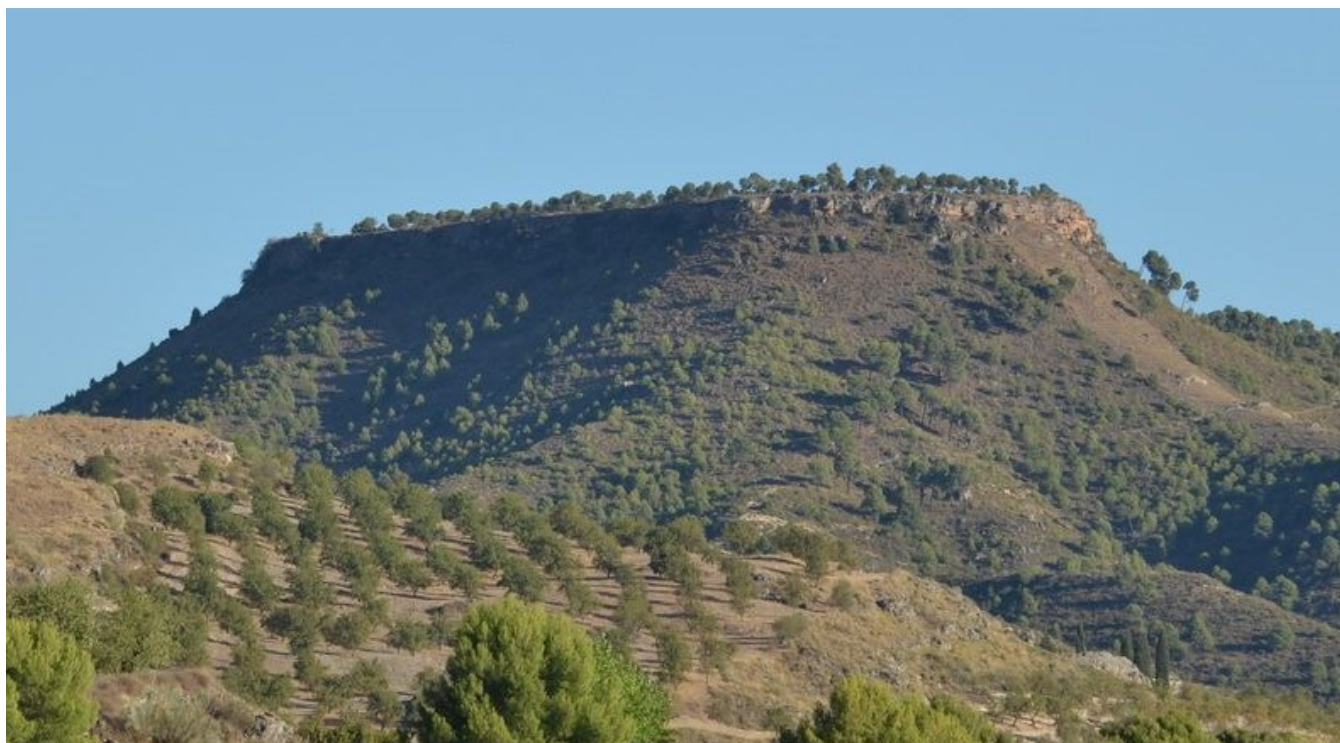
Mesa de Fornes.