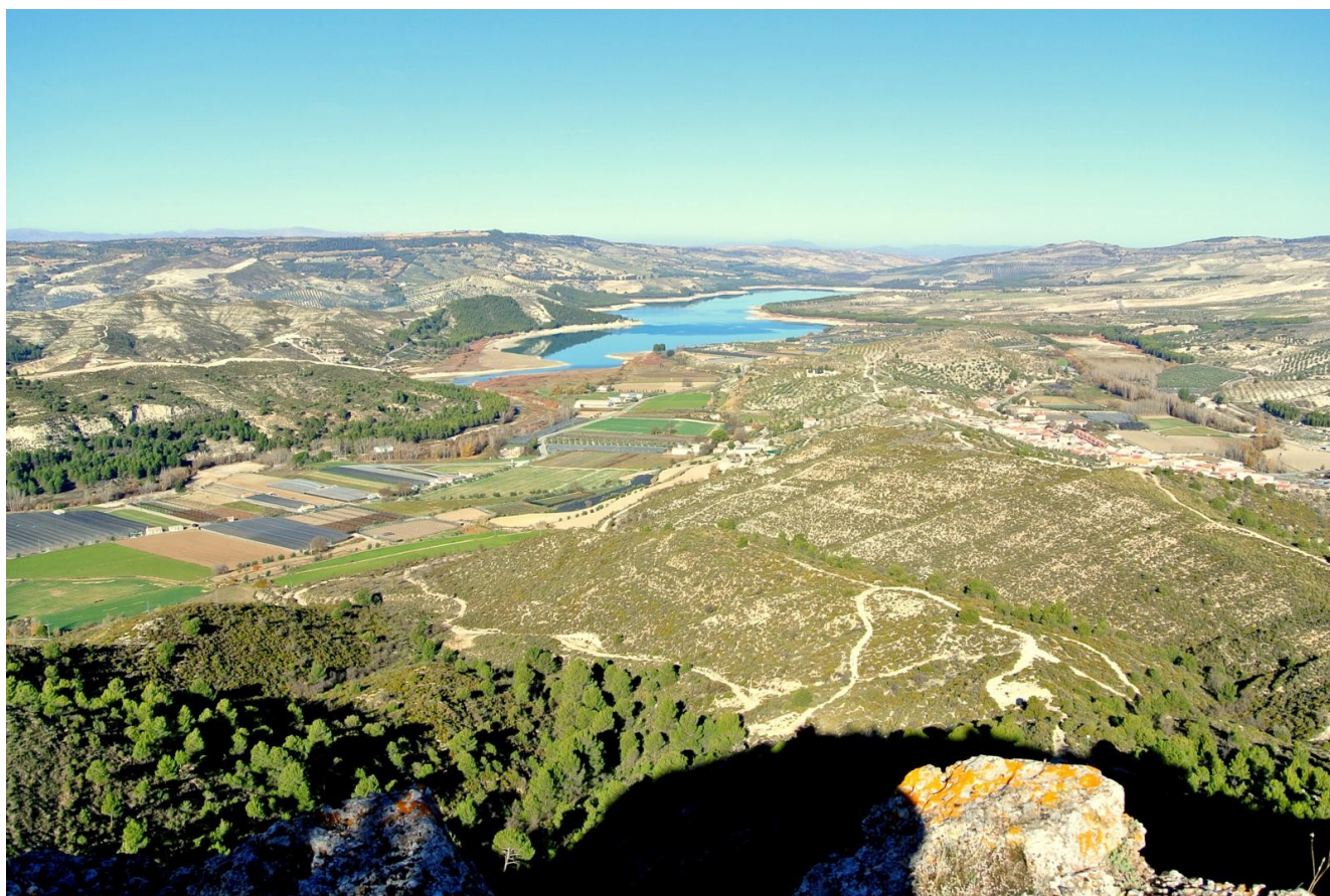
Embalse de los Bermejales desde la Mesa de Fornes.