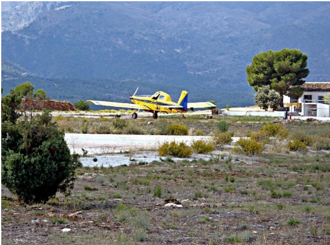
Pista de aterrizaje del Infoca en la Resinera.