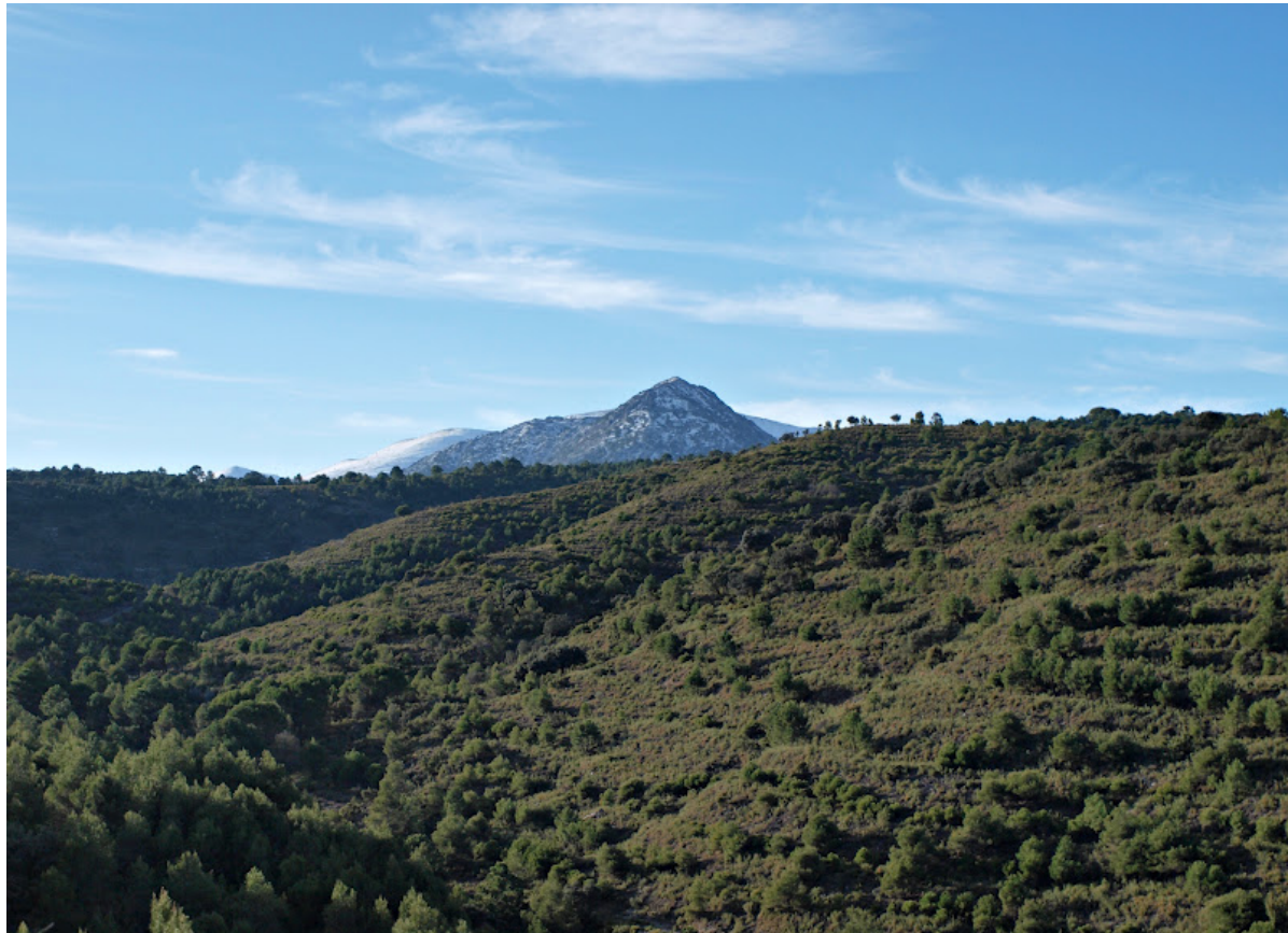
El Lucero desde la Resinera.