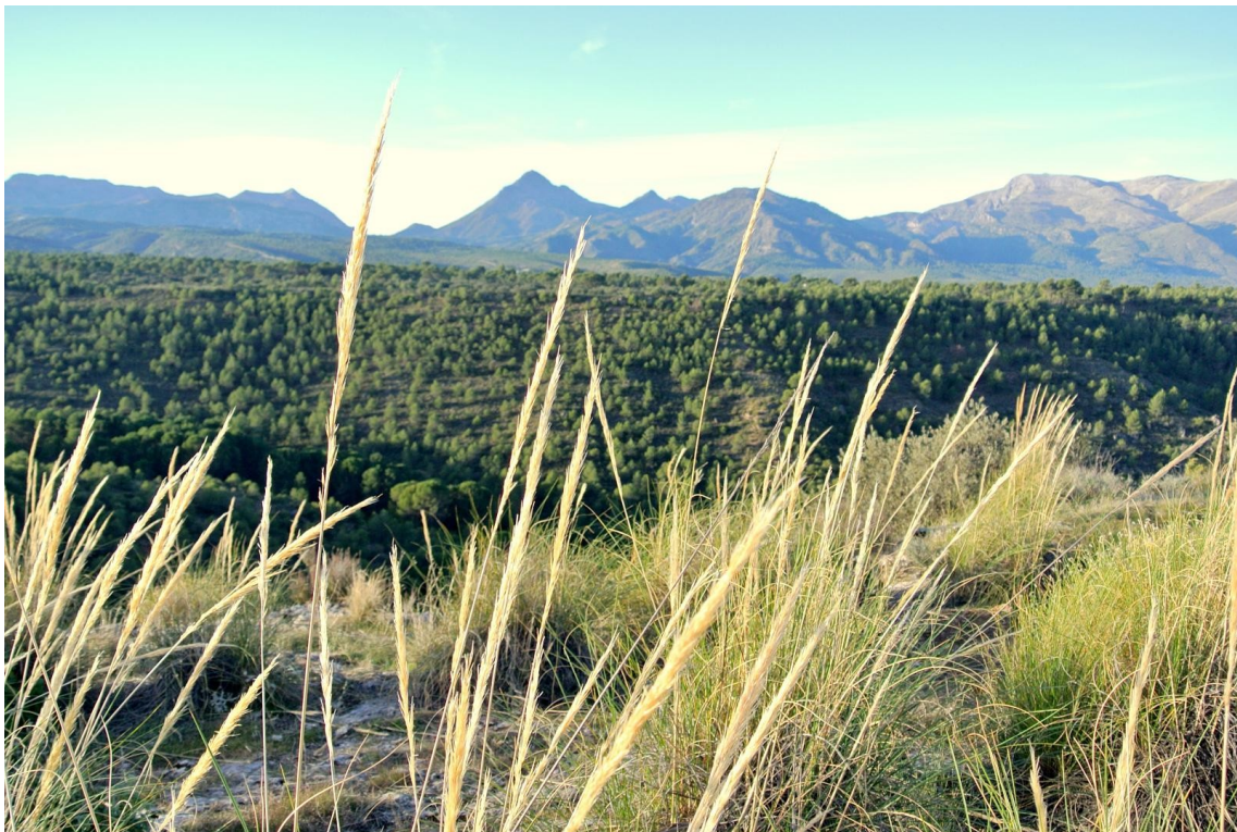
La cadena (S a Tejeda y Almijara) desde la Resinera.